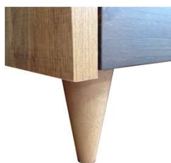
※木製脚拡大画像 …高さ10cm